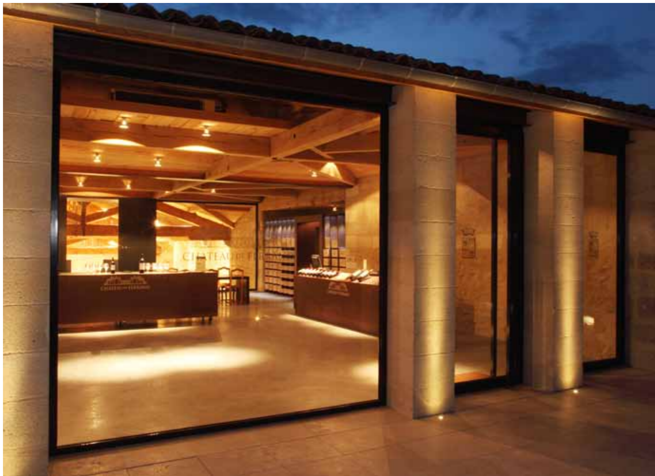
La salle de dégustation