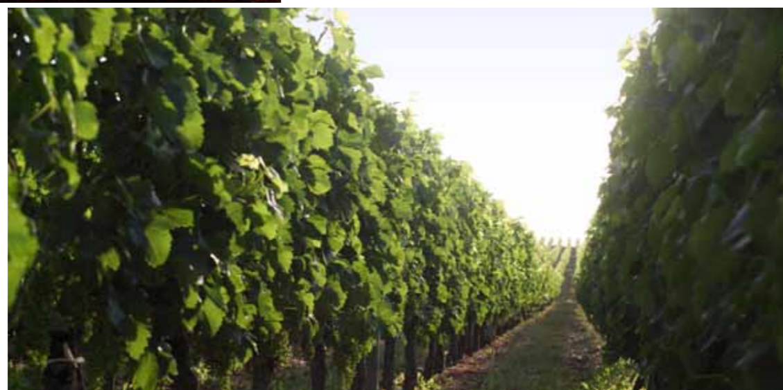
Les vignes de Ferrand