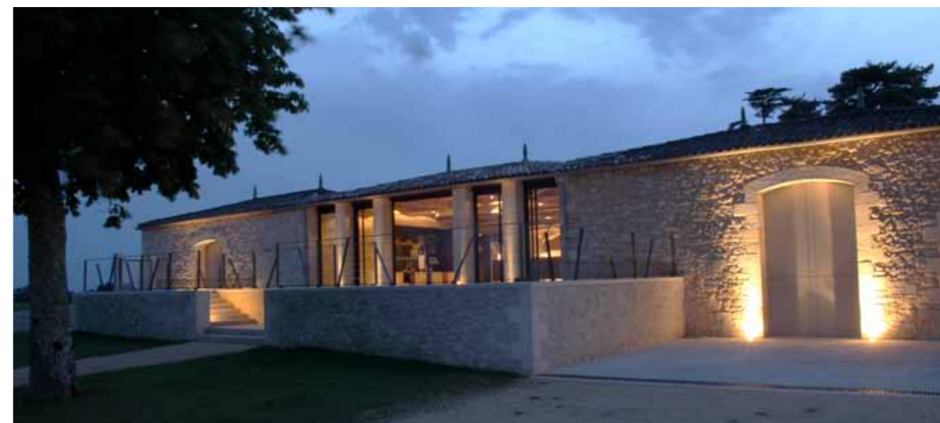
La salle de dégustation et les chais

En 2010, Pauline Chandon-Moët et sa famille ont apporté à la propriété d'importants investissements qui ont permis de moderniser les bâtiments d'exploitation. Ces bâtiments ont été repensés et recréés dans un esprit et une fonctionnalité contemporaine et réalisés par l'architecte Guy Troprès. Avec notamment :