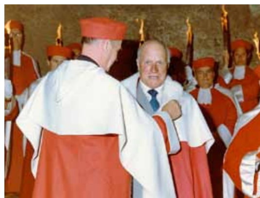
Baron Bich (1914 -1994)