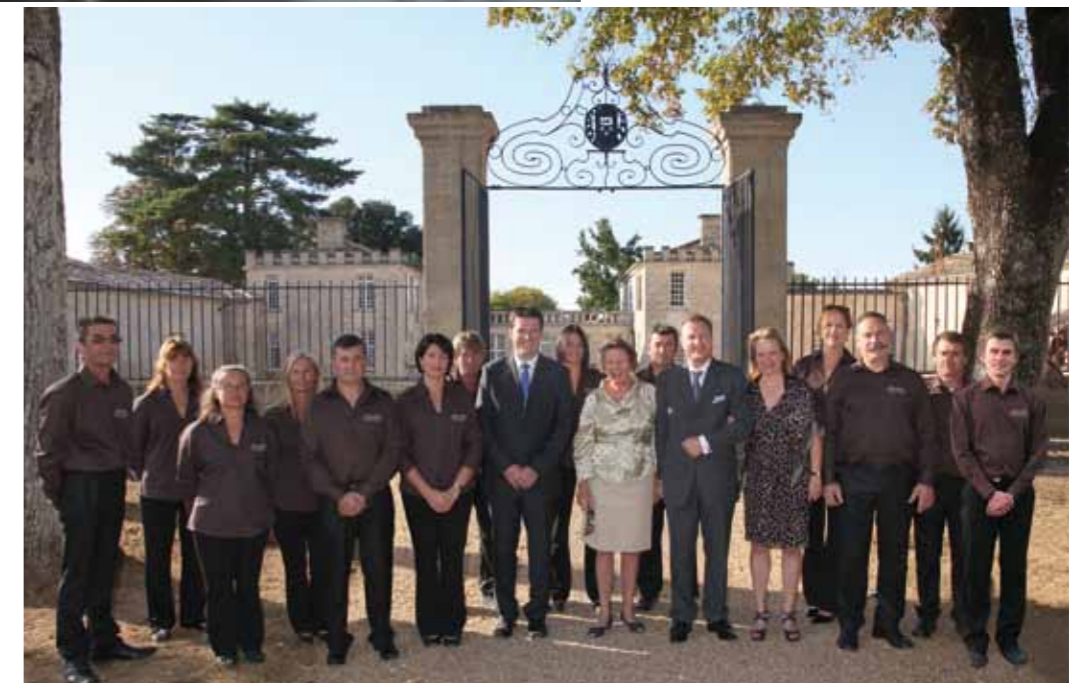
L'équipe du Château de Ferrand