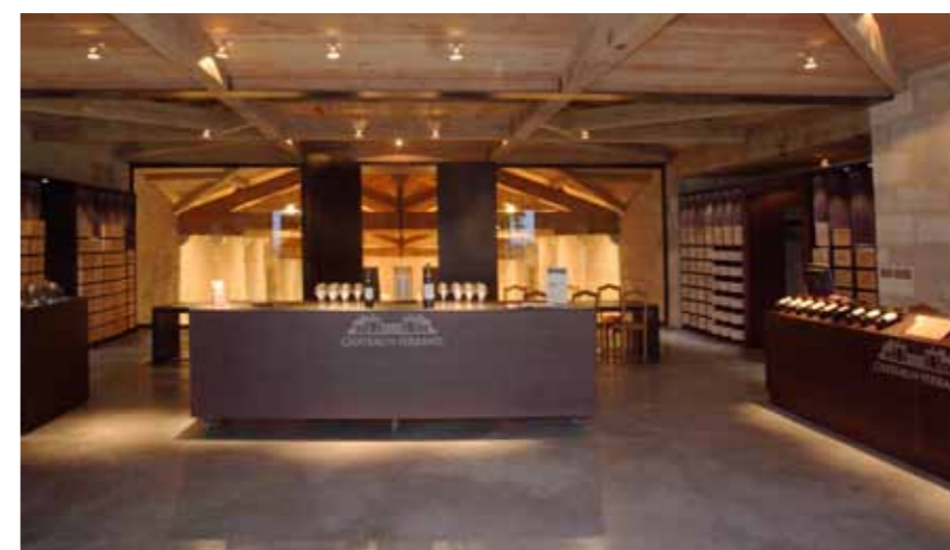
La salle de dégustation