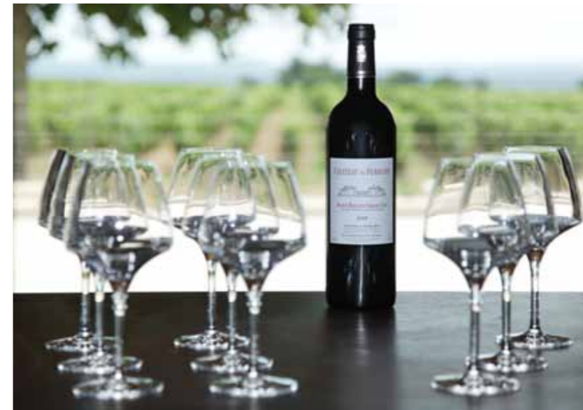
Château de Ferrand 2005

permet au Château de Ferrand de proposer des millésimes de 1995 à 2008. C'est ainsi qu'est garantie la pérennité du style et la qualité des vins. Ce mode de commercialisation très rare est l'un des composants de la notoriété du Château de Ferrand. Toutefois, depuis 2010, et à la demande croissante de dégustateurs professionnels, Ferrand fait découvrir ses vins en primeur.